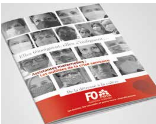
Recueil des Assistant(e)s maternel(le)s