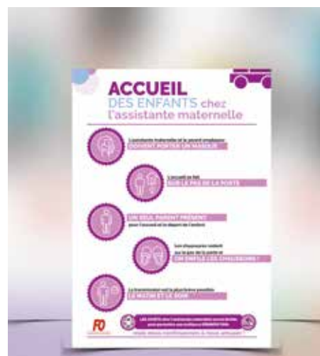
Affiche sur les gestes barrières