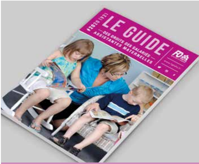
Guide des Assistant(e)s maternel(le)s