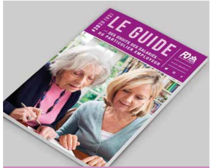
Guide des Salariés du Particulier Employeur